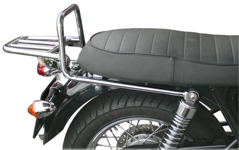
Vista del portapachi assemblato